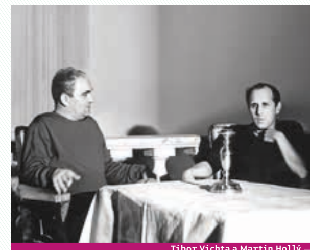
Tibor Vichta a Martin Hollý —

Pri Nočných jazdcov upozorňovali dobové recenzie napríklad na to, že Vichtovi vďačí Radoslav Brzobohatý za svoju dovedy najväčšiu a najlepšiu úlohu (prirodzene, nebrali do úvahy trezorové filmy z konca 60. rokov, ako sú Všichni dobří rodáci Vojtěcha Jasného či Kachyňovo Ucho ). Vyzdvihovali však aj scenár samotný alebo Vichtove dialógy, ktoré, ako napísali Zemědělské noviny , patria spolu s hudbou Svetozára Stračinu či vyrovnanými hereckými výkonmi k súčtu kvalít, vďaka ktorým si snímka „ zaslúži najväčšiu divácku pozornosť “. A Hollého pozornosť si príbeh získaval vtedy, keď v ňom tragédiu človeka motivovalo prostredie a okolnosti, ktoré hrdinu donútili k jeho údelu. „ Láka ma vždy skôr doba či situácia, je jedno, či súčasná, alebo nedávno minulá, a v nej sa nachádzajú ľudia, dobrí alebo horší, a v nich to, čo ich dovedlo k amorálnosti alebo čo ich, naopak, drží aj v ťažkých okamihoch pri morálnych zásadách, “ povedal Hollý pre Mladú frontu v roku 1981. ◀