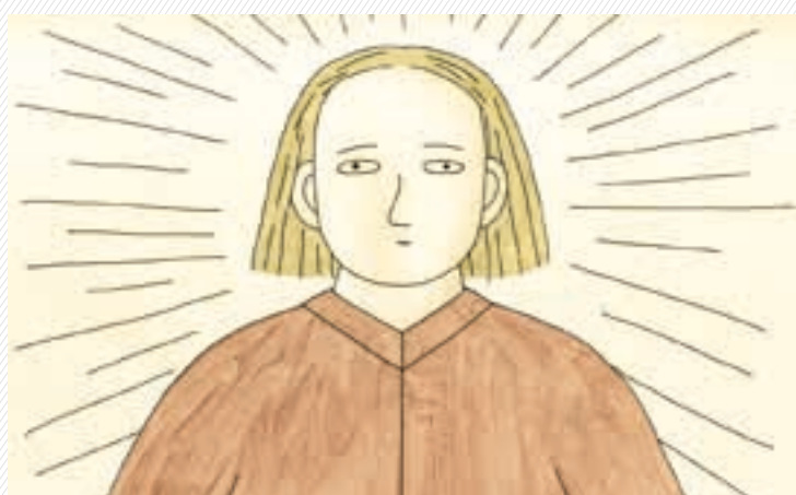
Bodkovaný chlapec —

— Najsilnejším zážitkom festivalu bolo ponoriť sa do šiestich blokov tematickej sekcie, venovanej tradíciám. Autori vybraných animácií sa pozreli z rôznych uhlov na vzorce, ktoré ako spoločnosť či už lokálne, alebo globálne opakujeme: na vzťah k svojej krajine, prírode či viere, na rodové stereotypy, s ktorými dennodenne bojujeme, aj na nový rozmer rozprávok a mýtov. Skladba týchto blokov sa organizátorom vydarila, vznikli rovnocenné skupinky a záver tvorili krátke diskusie s vybranými hosťami. Je však škoda, že vopred nahrané diskusie nešli viac do hĺbky a nereflektovali tému (ekologickú či