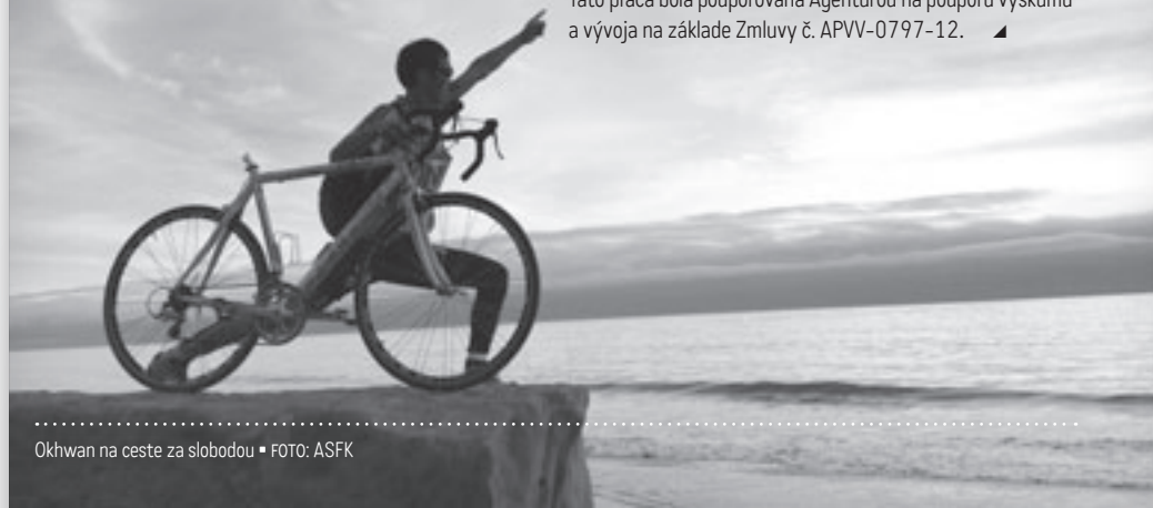
Okhwan na ceste za slobodou

Táto práca bola podporovaná Agentúrou na podporu výskumu a vývoja na základe Zmluvy č. APVV-0797-12. ▲