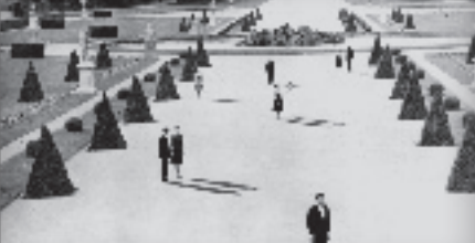
Vlani v Marienbade

Podnetom na nakrútenie politického trileru Nezvestný Costu-Gavrasy boli skutočné udalosti. Počas vojenského puču v jednej juhoamerickej krajine zmizne americký spisovateľ a filmár Charles Horman. Charlesova žena a otec sa ho pokúšajú nájsť, lenže v krajine, kde nefunguje právo a úrady namiesto toho, aby boli nápomocné a poskytovali informácie, kladú prekážky a šíria klamstvá, je to skoro nemožné. Napriek tomu dvojica nepoľavuje vo svojom úsilí, kým sa záhada zmiznutia nerozuzlí. ▲