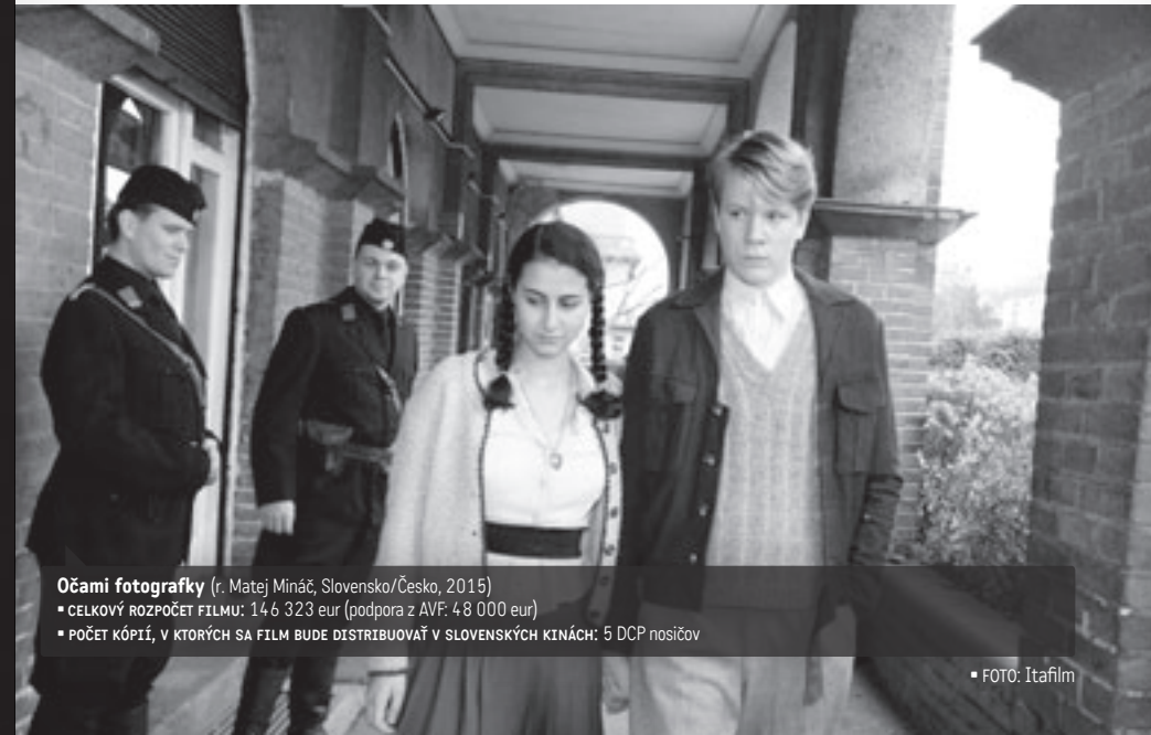
Očami fotografky (r. Matej Mináč, Slovensko/Česko, 2015)

Matej Mináč si nepotrpí na veľkolepé odkazy ani na samoučelné poučovanie diváka. „Na maminom príbehu nás fascinovalo jej tajomstvo z detstva. Prečo kvôli tomu celý život nespala? Pomôže jednoduché otvorenie Pandorinej skrinky, teda to jej vyrozprávanie mučivého tajomstva, v tom, aby našla vnútorný pokoj a konečne sa po sedemdesiatich rokoch zmierila so svojou nočnou morou? A teraz si úprimne povedzme: Kol'ki z nás majú takéto vnútorné tajomstvá, ktoré ich zožierajú?“ ▲