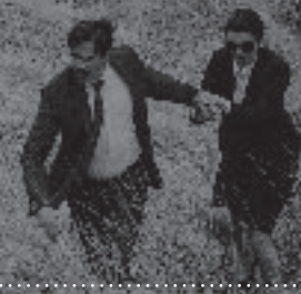
Záber z filmu Homár, ktorý bude na Cinematiku súťažiť.