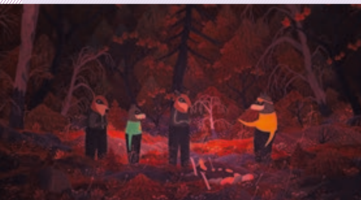
Divoké bytosti —