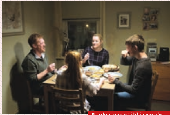
Pardon, nezastihli sme vás —

Okrem menovaných titulov uvedie sekcia Premiéry aj snímky U Zlatej rukavičky (r. Fatih Akin), An-