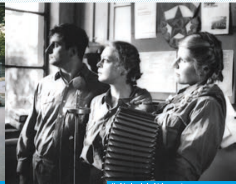
Keď hviezdy boli červené —