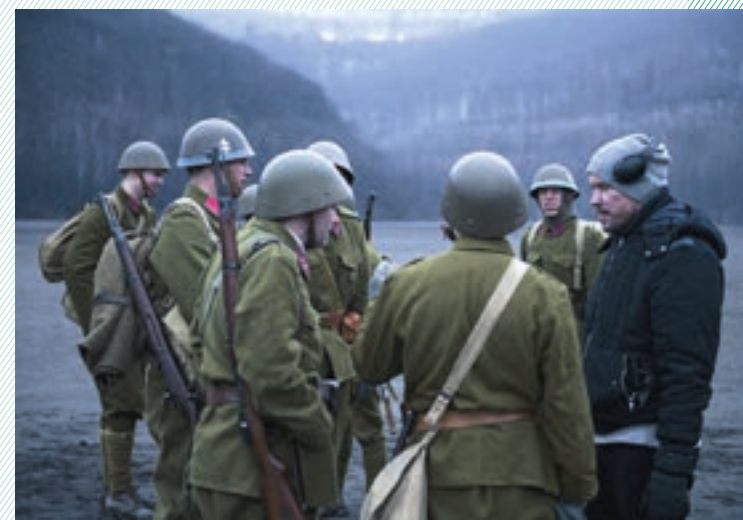
Malá ríša ( Little Kingdom, r. Peter Magát, Slovensko/Island, 2019 )

— Producentom Malej ríše je slovenská spoločnosť FilmFrame, koproducentom štúdio Bluefaces a islandská spoločnosť Loki Film production, maďarským partnerom projektu je Budapest Orchestra. Film vznikol s podporou Audiovizuálneho fondu a SPP. ◀