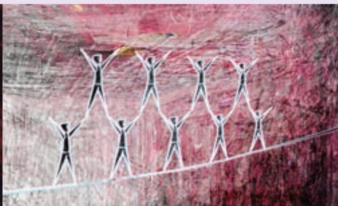
Music Box —