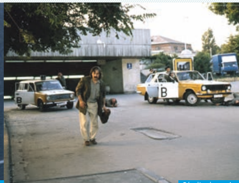
Dávajte si pozor! —