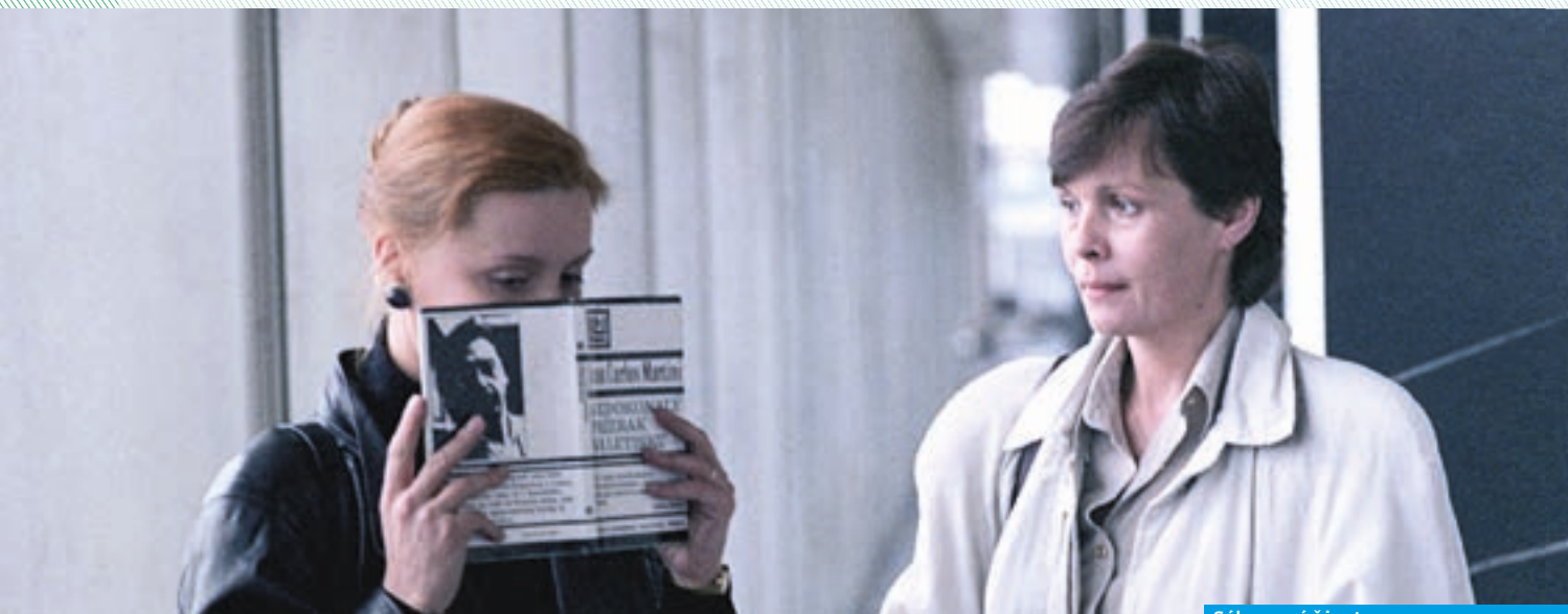
Súkromné životy —

Kým sa film dostane až k divákovi, má pred sebou dlhú cestu. Do roku 1989 bola lemovaná aj rozhodnutiami schvalovacích orgánov a ideologickými mantinelmi. Filmári ich obchádzali, ako vedeli. Potom prišiel November a mnohé pripravované snímky zo dňa na deň zostarli. Niektorým to ublížilo viac, iným menej. Ako zasiahla revolúcia do diel, ktoré v tom čase ešte neboli v cieli, ale iba na ceste k divákovi?