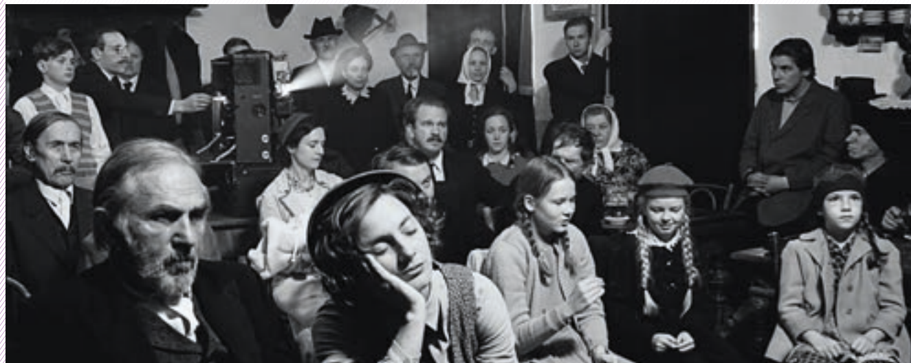
Krajina ve stínu —

Čiernobiela historická dráma Krajina ve stínu režiséra Bohdana Slámu vedie s počtom nominácií tak na Českých levoch, ako aj na Cenách českej filmovej kritiky. Česká filmová a televízna akadémia film nominovala v pätnástich kategóriách, kritici, ktorí ceny udeľujú striedamejšie len v niekoľkých základných kategóriách, prisúdili Slámovej novinke päťicu nominácií.