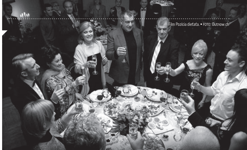
Film Pozícia dieťaťa.