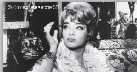
Zločin v exprese •

A to som ešte nespomenul tituly Komisár Maigret zúri , Osamelosť cezpolného bežca , Bez strechy a bez zákona a veľa ďalších. V kine Lumière je z čoho vyberať. ▀