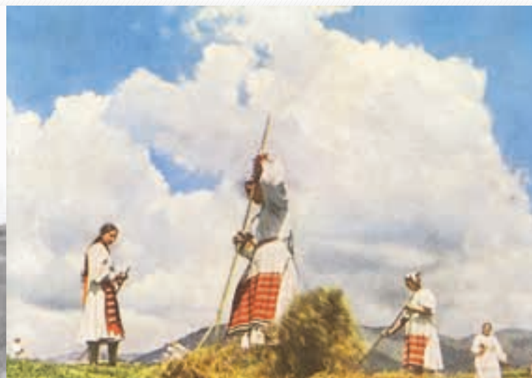
Hanka sa vydáva —