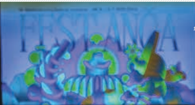
— text: bar — foto: Fest Anča/Juraj Starovecký a Šimon Lupták —