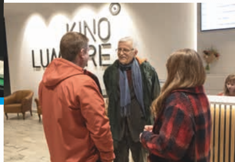
Dušan Hanák —