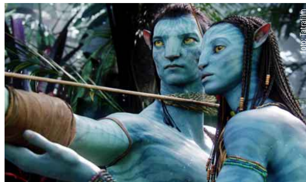
Najnasadzovanejším filmom v bratislavských multiplexoch bol v prvom štvrtroku 2010 divácky hit Avatar.

V súvislosti s programovaním multiplexov sa hovorí aj o sporadickom a nevhodnom nasadzovaní slovenských filmov. Buď sa nehrajú vôbec alebo krátko a nie v najlepší časoch. „Teším sa, že slovenské filmy pribúdajú do distribučnej ponuky, rovnako ako sa vždy teším a som hrdá, keď sa slovenskému filmu 'zadarí'. Ale čo sa týka nasadzovania – v našich multiplexoch platia pre ne rovnaké pravidlá, ako pre všetky ostatné filmy. Rozhodujúcim