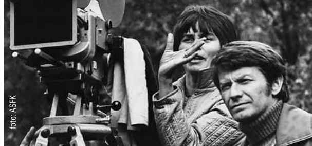
V októbri do našich kín príde aj celovečerný dvojdielny dokument 25 zo šesťdesiatych alebo Československá nová vlna , ktorý mal predpremiéru na MFF Art Film Fest.

Pät'násť percent premiér v druhom polroku bude dostupných i v čoraz rozšírejšom 3D formáte. Sú medzi nimi nielen očakávané hity Toy Story 3 , Shrek: Zvonec a koniec , ďalšie pokračovania kinohitov o Harry Potterovi (18. 11.) a o kronike Narnie (9. 12.) či animovaná rodinná komédia štúdia Walta